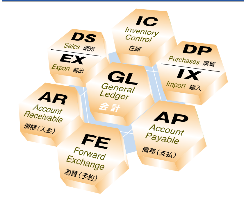
図1 GXシリーズのモジュール構成