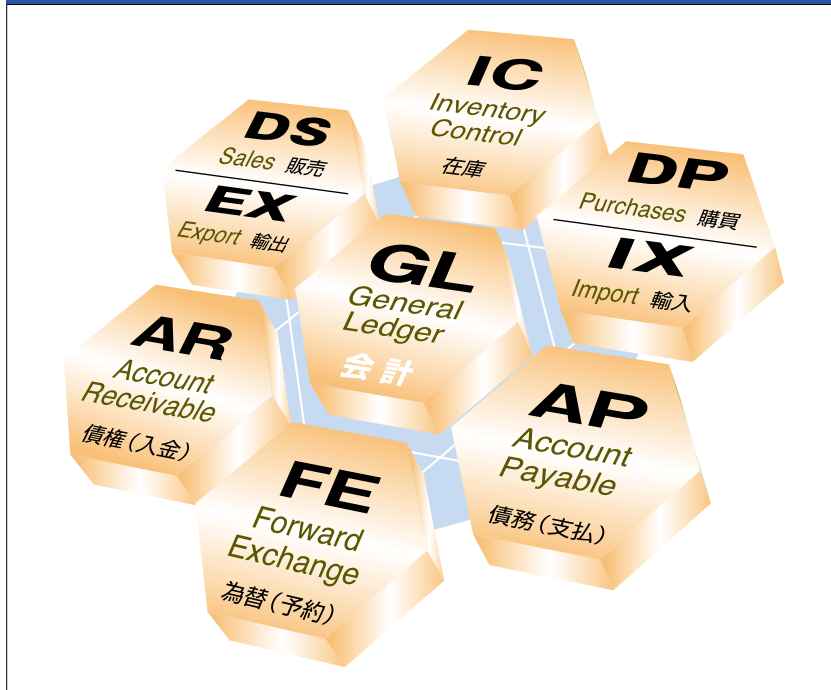
図1 GXシリーズのモジュール構成